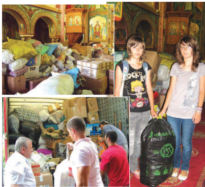
această acțiune! Cinste fiecărui suflet care a participat și a contribuit la

Am observat la biserică, în timp ce se strângeau ajutoarele, implicarea deosebită a tineretului, ceea ce este demn de reținut, apreciat și încurajat. Criticăm cu prea mare ușurință uneori aspecte exterioare de comportament sau de vestimentație a tinerilor, dar poate nu alocăm suficientă dragoste, răbdare și timp pentru a-i cunoaște în profunzime și nici nu le oferim prea des modele de viață autentice prin faptele noastre. Iată însă că, atunci când le oferim ocazia, vin ei spre noi cu fapte de laudă. Cinste lor, tinerilor care s-au implicat în